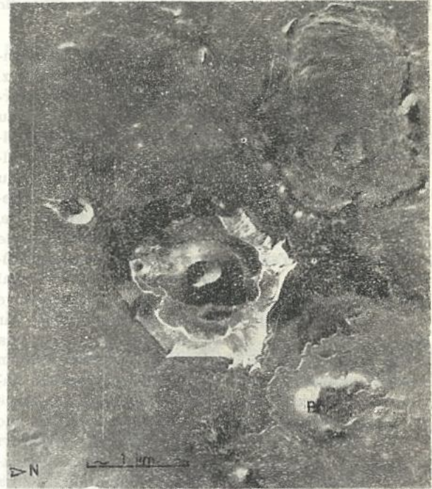
Şekil 2: Karapınar ilçesi (Konya) 8 km kadar doğu - güneydoğusunda Meke gölü çevresi. Göl bir volkanik çöküntü (Maar) içine yerleşmiştir. Maarın ortasında sonradan küçük bir volkan konisi meydana gelmiştir. A kraterinden çıkan akıcı lavlar küçük bir tabla şekilli volkan oluşturmuştur. B ile işaretlenmiş volkan da bu türdendir. Sol ortadaki küçük çukurluk da olasılıkla bir volkanik çöküntüdür. Fotoğrafta görülen küçük beyaz çizgiler yollardır.

Arazinin bu ilginç özelliği iki noktayı düşündürmektedir :